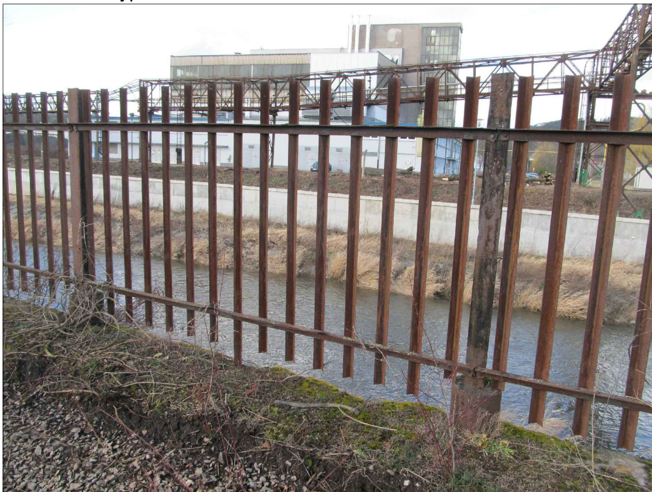
OPLOCENÍ typ 2