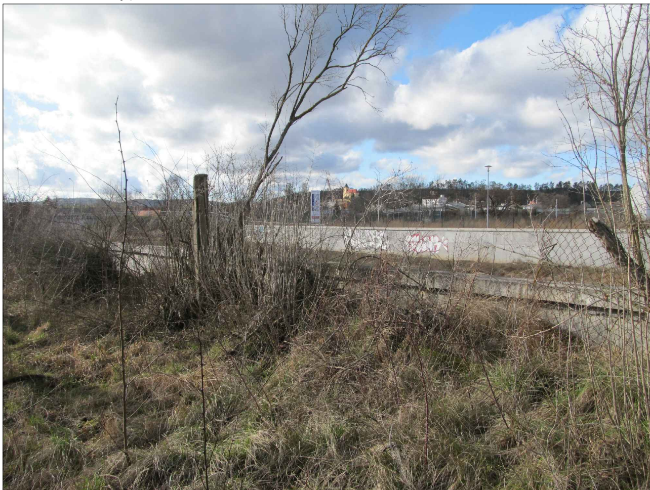
OPLOCENÍ typ 4